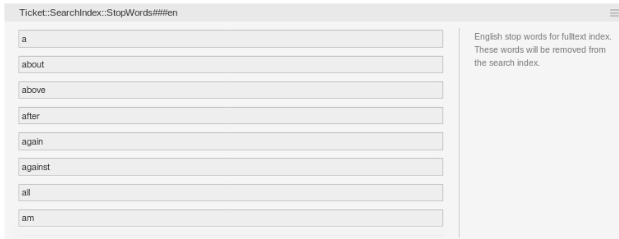
图 3: Ticket::SearchIndex::StopWords###en 设置